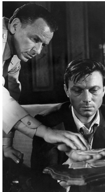
1962 UN CRIME DANS LA TÊTE (The Manchourian Candidate) de J. Frankenheimer avec Frank Sinatra