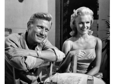
1963 LE DEUXIÈME HOMME (The Running Man) de Carol Reed avec Lee Remick