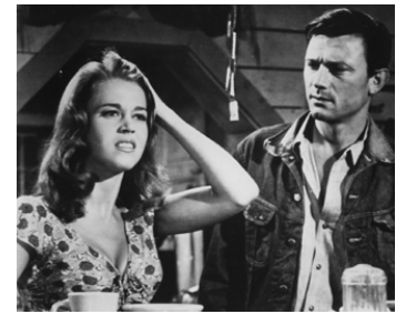
1961 LA RUE CHAUDE (Walk on the wild Side) d'Edward Dmytryk avec Jane Fonda