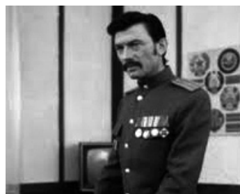
1972 LA FUITE VERS LE SOLEIL (Escape to the Sun) de Menahem Golan