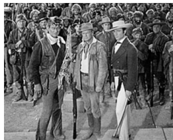
1960 ALAMO (The Alamo) de John Wayne avec John Wayne, Richard Widmark