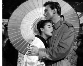
1962 CITOYEN DE NULLE PART (A Girl named Tamiko) de John Sturges avec France Nuyen