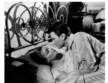
1958 LES CHEMINS DE LA HAUTE VILLE (Room at the Top) de Jack Clayton avec Simone Signoret