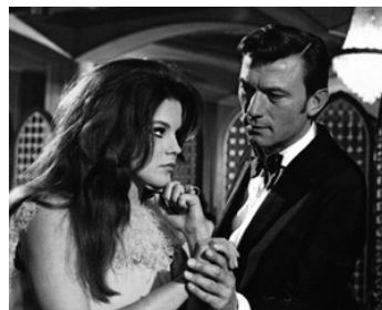
1969 RÉBUS (El Crimen ambién juega) de Nino Zanchin avec Ann-Margret