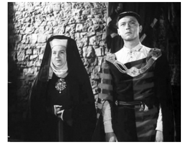
1949 LA ROSE NOIRE (The Black Rose) de Henry Hathaway avec Mary Clare