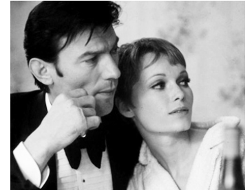
1967 MALDONNE POUR UN ESPION (A Dandy in Aspic) d'A. Mann et L. Harvey avec Mia Farrow