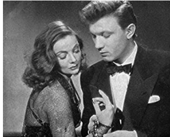
1952 LES FILLES DE LA PÉNOMBRE (Women of Twilight) de Gordon Parry avec Lois Maxwell