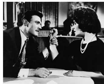
1960 VÉNUM EN VISON (Butterfield 8) de Daniel Mann avec Elizabeth Taylor