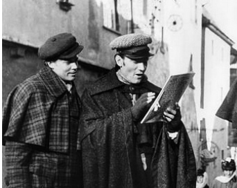
1962 LES AMOURS ENCHANTÉES (The Brothers Grimm) d'Henry Levin avec Karlheinz Boehm