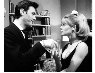
1965 DARLING (Darling) de John Schlesinger avec Julie Christie