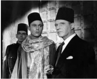
1950 LA ROUTE DU CAIRE (TCairo Road) de David MacDonald avec Eric Portman