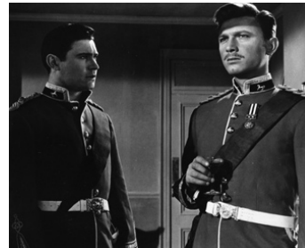
1955 LES QUATRE PLUMES BLANCHES (Storm over the Nile) de T. Young avec Roland Lewis