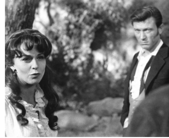
1964 L'OUTRAGE (The Outrage) de Martin Ritt avec Claire Bloom