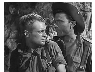
1960 PATROUILLE PERDUE (The long and the short and the tall) de L.Norman avec David McCallum