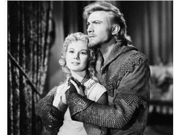
1954 RICHARD CŒUR DE LION (King Richard and the Crusaders) de D. Butler avec Virginia Mayo