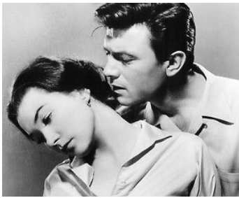
1961 ANNA ET LES MAHORIS (Two Loves) de Charles Walters avec Shirley MacLaine