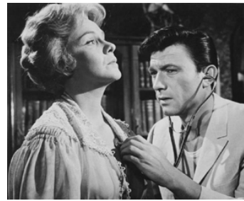
1961 ÉTÉ ET FUMÉES (Summer and Smoke) de Peter Glenville avec Geraldine Page