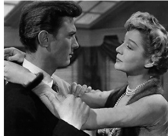
1953 LES BONS MEURENT JEUNES (The Good die young) de Lewis Gilbert avec M. Leighton