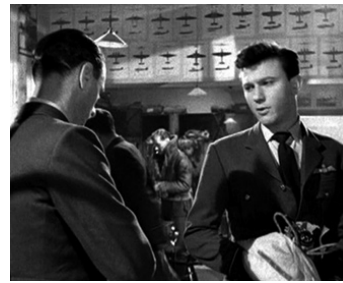
1949 LANDFALL (Landfall) de Ken Annakin avec Dennis O'Dea