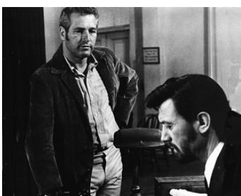
1970 WUSA (W.U.S.A.) de Stuart Rosenberg avec Paul Newman