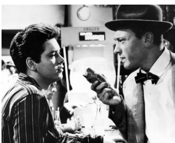
1959 EXPRESSO BONGO (Expresso Bongo) de Val Guest avec Cliff Richards