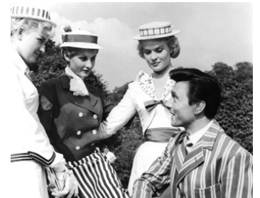
1956 TROIS HOMMES DANS UN BATEAU (Three Men in a Boat) de K. Annakin avec Sh.Eaton, J. Ireland