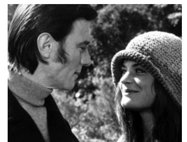
1973 WELCOME TO ARROW BEACH de Laurence Harvey avec Meg Foster