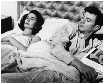
1965 LES CHEMINS DE LA PUISSANCE (Life at the Top) de Ted Kotcheff avec Jean Simmons