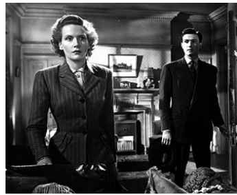
1948 LE DÉSERTEUR (Man on the Run) de Lawrence Huntington avec Joan Hopkins