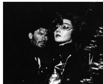
1969 L'ASSOLUTO NATURALE de Mauro Bolognini avec Sylva Koscina