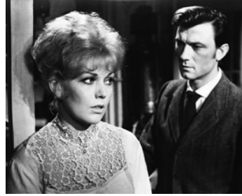
1963 L'ANGE PERVERS (Of Human Bondage) de Ken Hughes avec Kim Novak