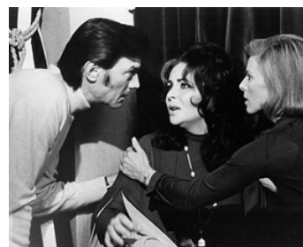
1972 TERREUR DANS LA NUIT (Night Watch) de Brian G. Hutton avec E. Taylor, B. Whitelaw