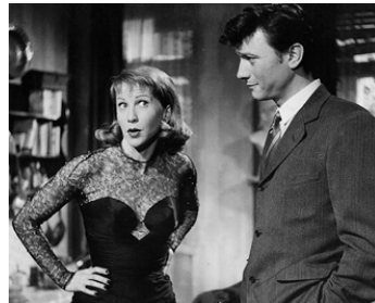
1955 UNE FILLE COMME ÇA (I am a Camera) de Henry Cornelius avec Julie Harris