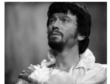
1969 UN BEATLE AU PARADIS (The Magic Christian) de Joseph McGrath