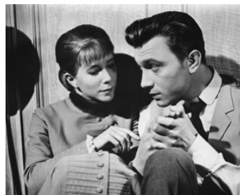
1957 LA VÉRITÉ SUR LES FEMMES (The Truth about Women) de Muriel Box avec Julie Harris