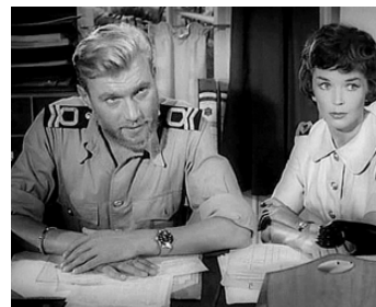
1957 L'ENNEMI SILENCIEUX (The silent Enemy) de William Fairchild avec Dawn Addams