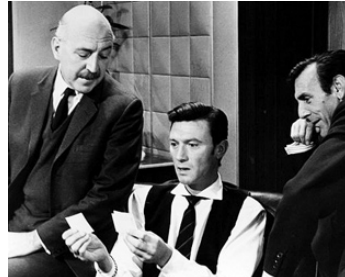
1965 L'ESPION AU NEZ FROID (The Spy with a cold Nose) de Daniel Petrie avec Eric Sykes, L. Jeffries