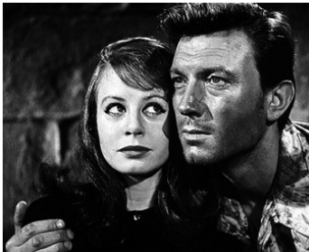
1963 LA CÉRÉMONIE (The Ceremony) de Laurence Harvey avec Sarah Miles